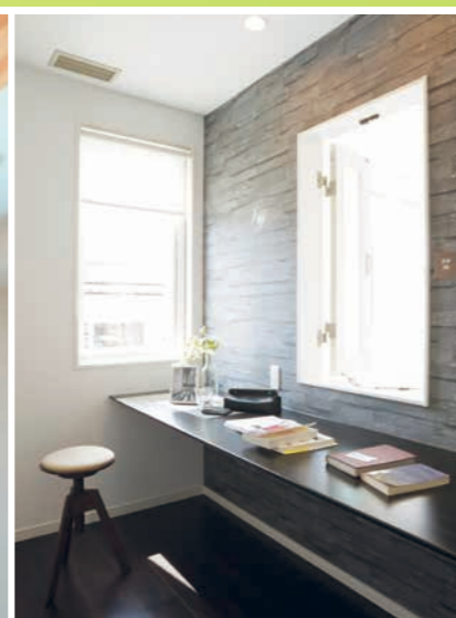
※掲載の写真は当社施工事例で今回ご見学いただく建物とは異なります。