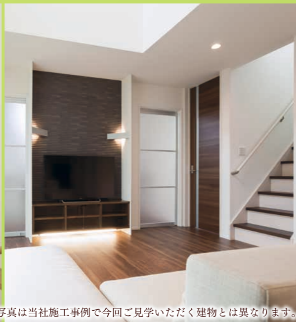
※掲載の内観写真は当社施工事例で今回ご見学いただく建物とは異なります。